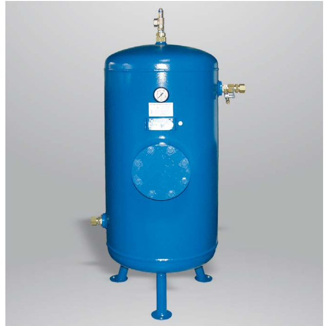
Form B: stehend