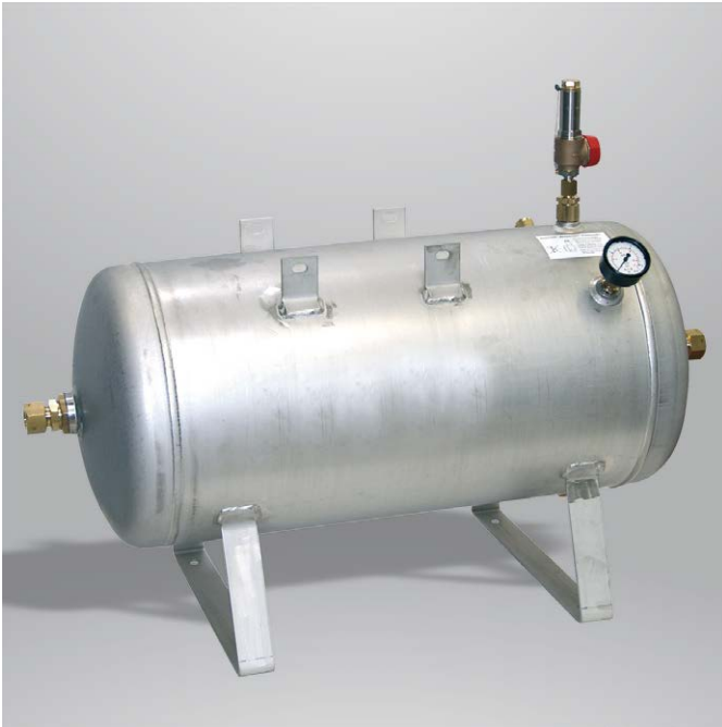
Form A: liegend