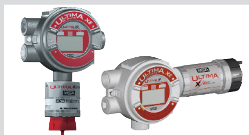
ULTIMA X Series